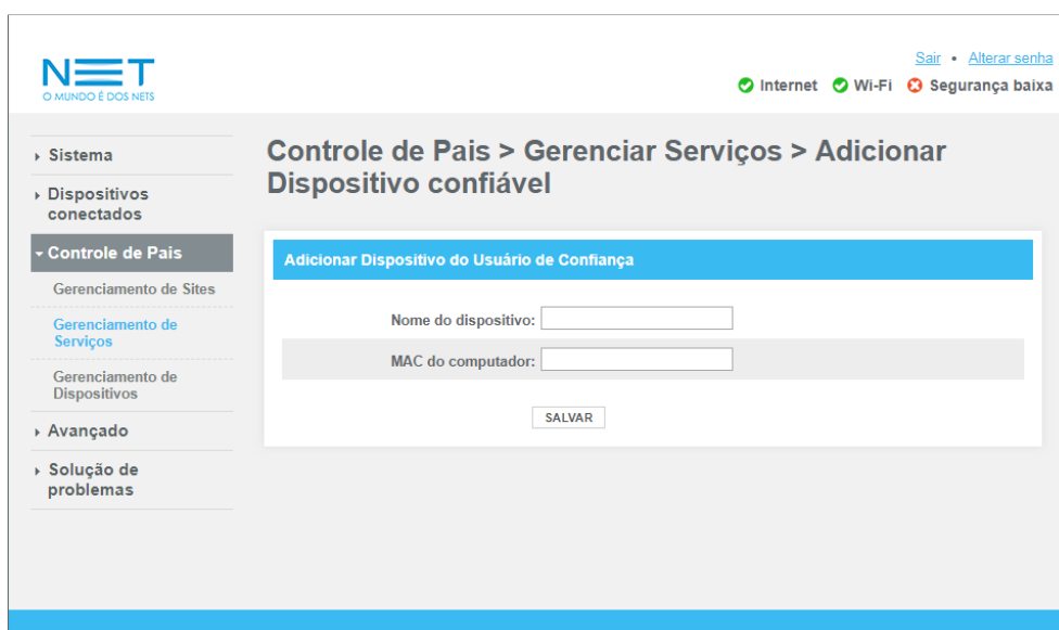
Página Add Trust Computer