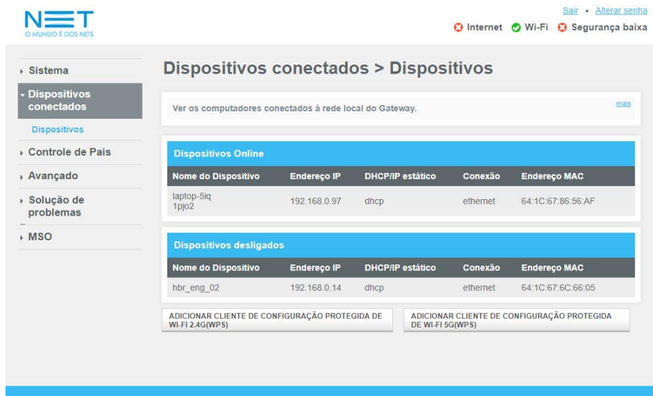
Página de computadores

Observação: Ative o WPS antes que um dispositivo sem fio possa se conectar ao Gateway usando o WPS.